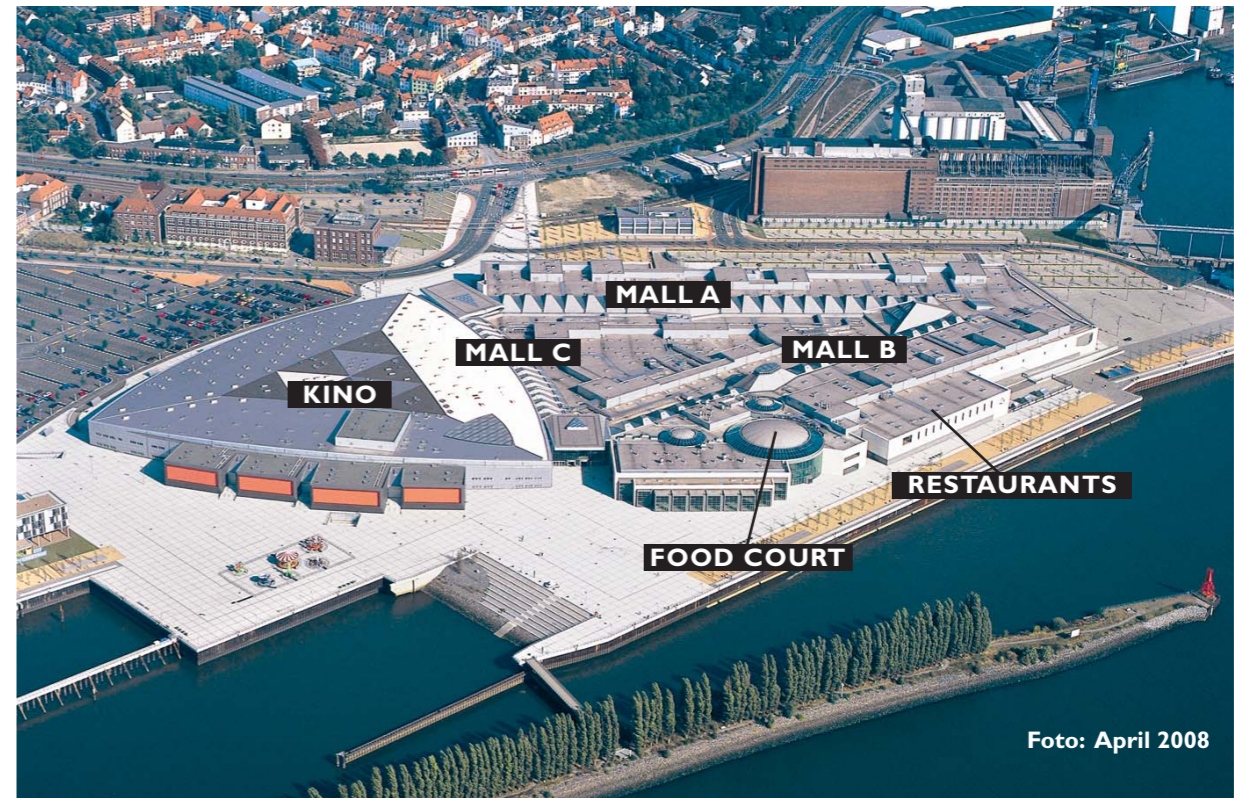
Foto: April 2008